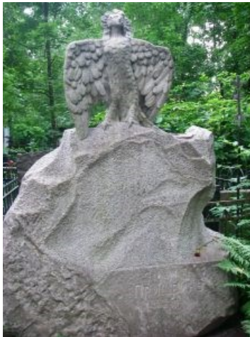
Надгробие на могиле Пришвина

В последние годы жизни Пришвин, как и всегда, очень много трудился. Свое последнее произведение «Глаза змеи» напечатанным он уже не увидел. Оно было опубликовано через три года после его смерти, в 1957 году. На пороге восьмидесятилетнего юбилея у писателя был диагностирован рак желудка.